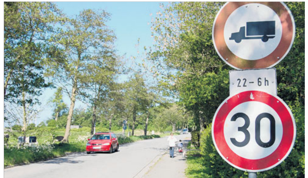
Bei einer Förderung durch das Land müsste das Tempo-Limit – zumindest in Teilen – und auch das Durchfahrtsverbot für Lastwagen im Ekeler Weg fallen.

Am Nachmittag hatte es laut Schlag ein Gespräch mit Vertretern der Landesbehörde für Straßenbau und Verkehr in Oldenburg gegeben. Dabei war die Förderfähigkeit des Ausbaus besprochen worden. Wie berichtet, hatte das Land Norden 450.000 Euro Fördergeld in Aussicht gestellt. Voraussetzung dafür ist, dass die Straße in ihrer