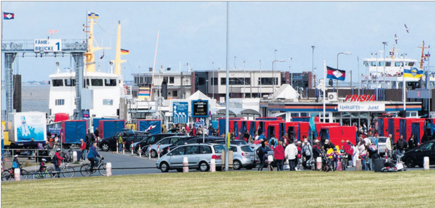
Im Hafen von Norddeich prallen die Interessen vieler aufeinander. Die Stadt möchte mit ihrer Planung für geordnete Ver- hältnisse sorgen, die es in der Vergangenheit nicht immer gab.

Die Redaktion Norden der Ostfrie- sen-Zeitung erreichen Sie unter Telefon 04931-9275-13 bis -15 Fax: 04931-9275-19 E-Mail: red-norden@oz-online.de