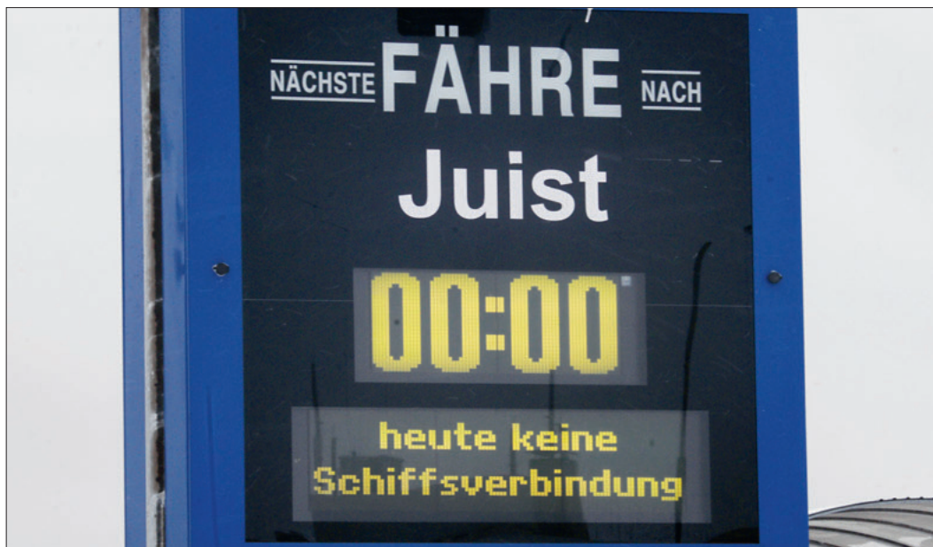
Schiffsverbindungen nach Juist wird es auch in Zukunft geben – nur ist weiterhin nicht geklärt, wo die Schiffe ablegen sollen.

Die städtebauliche Zielplanung – mit Juist-Terminal und Parkhaus – wäre wieder einmal in weite Ferne gerückt.